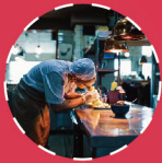
烹饪设备及制冷设备 CATERING EQUIPMENT