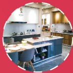
餐饮上下游配套 CATERING UPSTREAM & DOWNSTREAM INTEGRATION