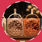
连锁加盟 CHAIN FRANCHISE