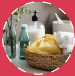
酒店用品 HOTEL SUPPLIES