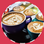
咖啡与茶 COFFEE AND TEA