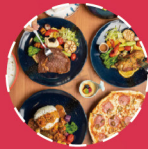
高端食材及调味品 PRE-PREPARED INGREDIENTS & CONDIMENTS