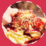
烘焙轻餐 BAKING AND LIGHT MEAL